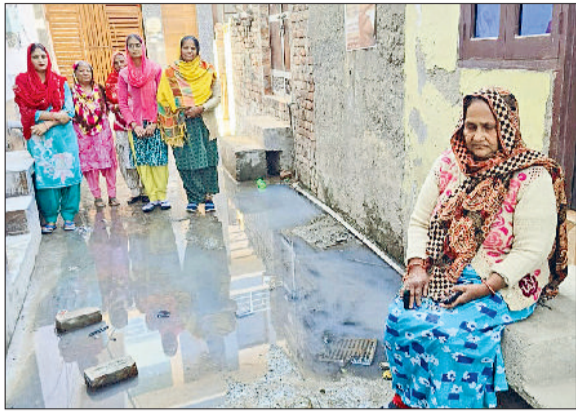
झज्जर। गढ़ी मोहल्ला में गली में फैला गंदा पानी दिखाते हुए महिलाएं।