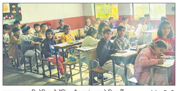
बहादुरगढ़। प्रतियोगिता में पेंटिंग और ड्राइंग बनाते विद्यार्थी।