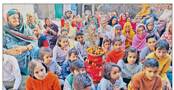
बहादुरगढ़। ग्रामीण क्षेत्र में तुलसी पूजन करती महिलाएं व बच्चे।

बहादुरगढ़। लडरगण स्थित श्री स्वामी समर्थ इंटरनेशनल स्कूल में क्रिसमस के अवसर पर एक क्रियात्मक एवं रचनात्मक प्रतियोगिता का आयोजन किया गया। कक्षा दूसरी से लेकर 12वें के विद्यार्थियों ने इसमें भाग लिया। विद्यार्थियों ने पर्यावरण बचाओ तथा जल की जीवन है विषय पर पेंटिंग और ड्राइंग के माध्यम से अपनी प्रस्तुति दी। स्कूल द्वारा प्रतियोगिता संबंधी सभी वस्तुओं की व्यवस्था की गई थी। करीब डेढ़ सौ विद्यार्थियों ने कला के माध्यम से अपने माता को प्रस्तुत किया।