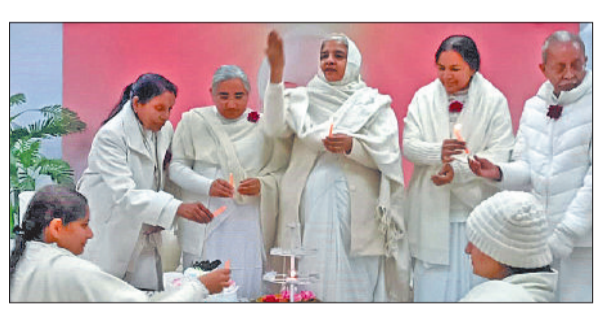
बहादुरगढ़। कार्यक्रम के दौरान केक काटती ब्रह्माकुमारियां।