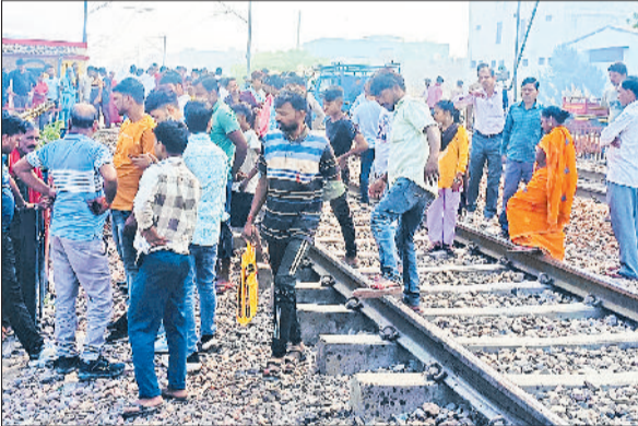
बहादुरगढ़। एक हादसे के बाद रेलवे ट्रैक पर जुटी भीड़।

जीआरपी सीमा के तहत आने वाले टिकरी बॉर्डर से सांपला और झज्जर रेलवे लाइन के क्षेत्र में एक जनवरी 2025 से अब तक कुल 65 मौतें दर्ज की गई हैं। इनमें 12