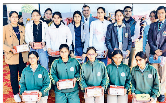
झज्जर। प्रबंधन समिति सदस्यों के साथ उपस्थित होनहार विद्यार्थी।