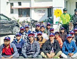
झज्जर। शिविर में उपस्थित स्वयंसेवक एवं वक्ता।

शहीद लांस नायक मुकेश कुमार राजकीय वरिष्ठ माध्यमिक विद्यालय बेरी में सात दिवसीय एनएसएस शिविर के तीसरे दिन एनएसएस स्वयंसेवकों द्वारा प्रभात फेरी निकाली गई। इसके स्वयंसेवक माता भीमेश्वरी देवी मंदिर परिसर में स्थित