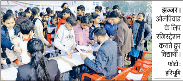
झज्जर। ओलिंपियाड के लिए रजिस्ट्रेशन कराते हुए विद्यार्थी।

जीआरपी द्वारा चलाए जा रहे निरंतर जागरूकता अभियानों के कारण रेलवे ट्रैक पर होने वाली मौतों की संख्या में साल-दर-साल कमी देखी जा रही है। जहां वर्ष 2022 में 102 लोगों की जान गई थी, वहीं 2023 में यह संख्या घटकर 98 और 2024 में 87 रह गई। इस साल अब तक यह आंकड़ा 65 पर है। यह दर्शाता है कि जागरूकता के प्रयास रंग ला रहे हैं, लेकिन पूर्ण सुरक्षा के लिए नागरिक सहयोग अनिवार्य है। बहादुरगढ़ से रोजाना करीब 150 से अधिक एक्सप्रेस और मालगाड़ियां गुजरती हैं। रेलवे ने सुरक्षित आवाजाही के लिए फुट ओवर ब्रिज, अंडरपास और पलाइंडोवर की व्यवस्था की है, लेकिन जल्दबाजी में लोग अपनी जान जोखिम में डालते हैं। पुलिस अधिकारियों ने अपील की है कि नागरिक अपने जीवन की कीमत समझें व हमेशा निर्धारित सुरक्षित रास्तों का ही उपयोग करें।